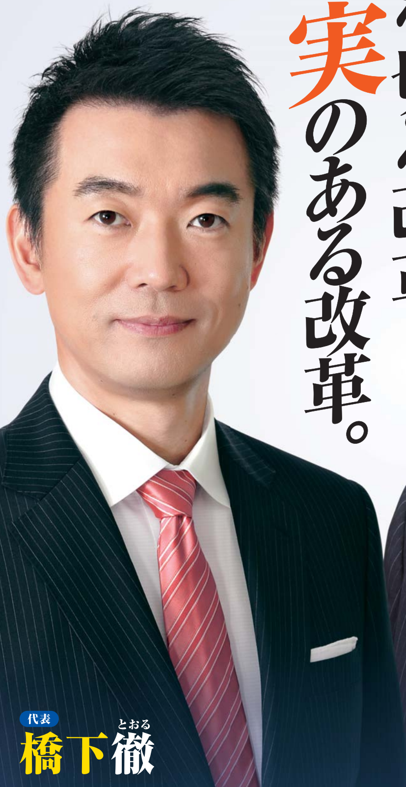
代表 とおる 橋下徹