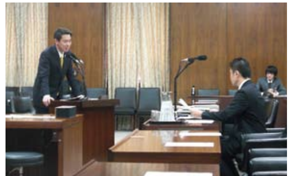
予算委員会第八分科会にて、前原国交相と。